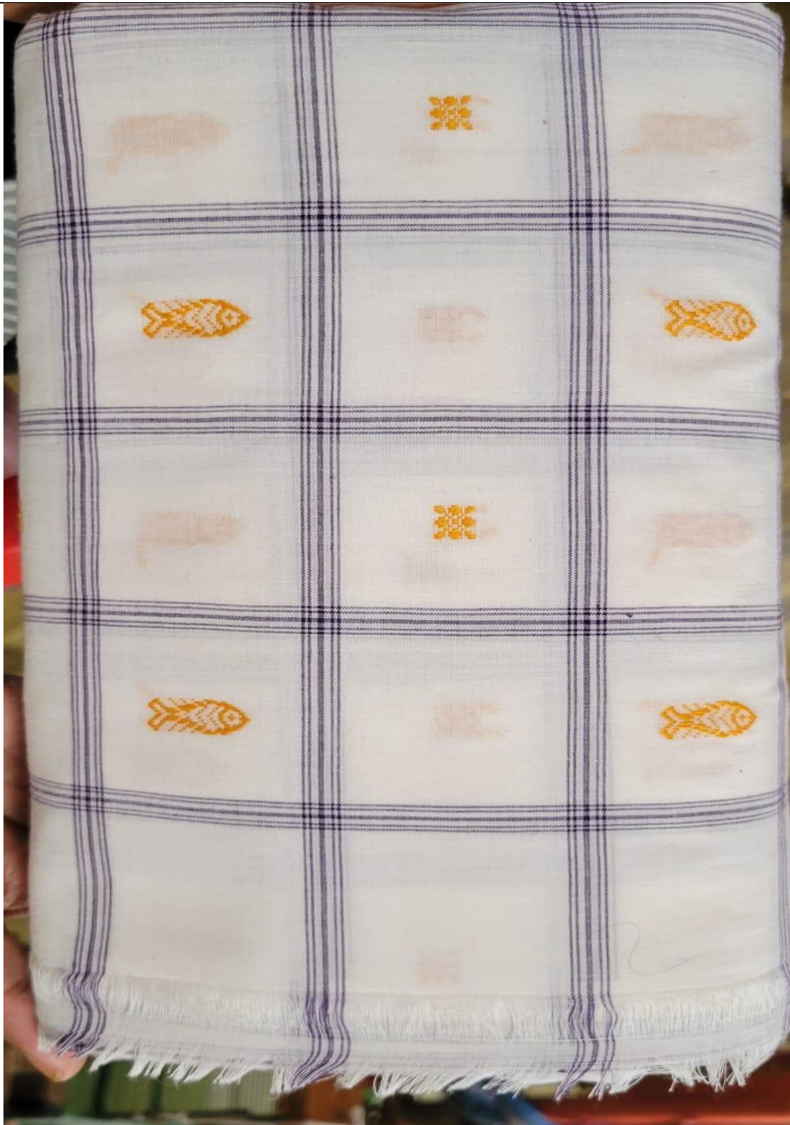
Running yardage (than) for Shirting